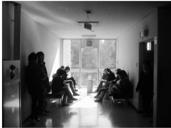
▲現在の喫煙所は受動喫煙の温床だとする指摘も多い。

「将来的には大学のキャンパス内全てを禁煙にする予定です。禁煙に関する情報が公開されてきたわけではなく、学生にとっては突然の事と思えますが、理解を示して校舎内の禁煙に協力して欲しいですね。また新たな制限が実施されれば、タバコを止めようと考えている学生にとつての良ききっかけになると思います。」