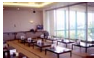
お風呂上りには畳の上でのんびり休みましょう。眠たくなっちゃいそう！ (写真左)

個々の個室のように仕切りが及びており、シャンブーとリンスとボディーソープが個々に設置されています。では、まずはメインの一番広い風呂から。天然温泉らしく色が硫黄の黄色で体に良さそうです。また、リラックス出来ます。このお風呂からは多摩丘陵の市街地が一望できます。さて、十分温まったところで屋外にある打たせ湯に行ってみましょう。打た