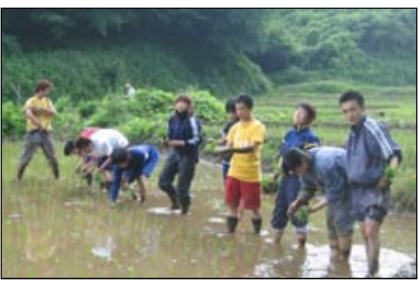
ASIATOのメンバーが田んぼで作業している様子。

ASIATOは学内外でいろいろな表彰されている。学内ではISO取得に对学生が行っている環境活動として紹介され、学外では二〇〇三年に全国大学生環境活動コンテストにおいて特別賞を受賞している。現在は環境NGO・NPOの活動に参加するなど学外へ積極的に進出しており、東薬内では注目すべきサークルだろう。特に生命科学部環境生命科学科の学生にとっては普段学んでいることが環境に直結しているか疑問に思つたことがあるならASIATOに参加してみると良いと思う。里山は自然と人が共生する場所というものの現代の人間の生活と自然のサイクルを合わせるのは簡単ではない。学生だからとこの簡単でないことを楽しんで活動できるのだと思う。新聞会は今後も彼等の動向に注目して行きたい。