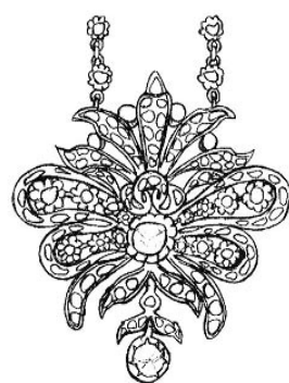
▲周囲の宝石は全部ダイヤモンド